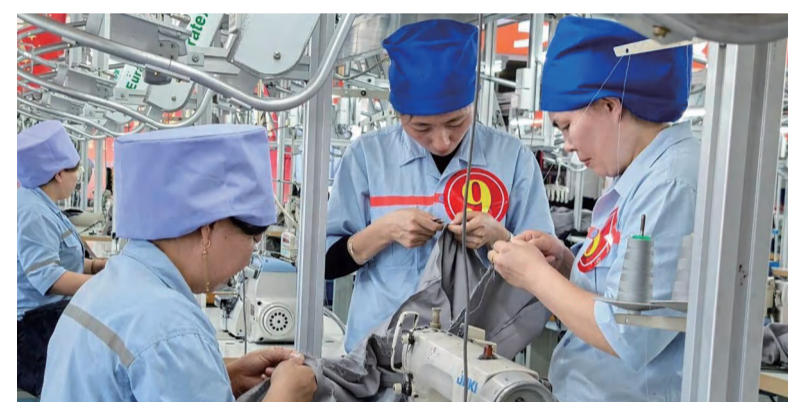
中核同心防护女工在生产现场

本报讯 近日,2024全球减贫与发展高层论坛在北京召开,来自30个国家的政府官员、26位驻华使节、10个国际组织及专家学者、社会团体、企业、媒体等约300名代表出席论坛。会上正式公布第五届全球减贫最佳案例名单。